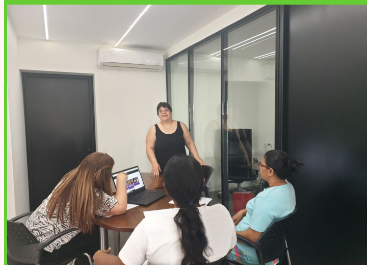
Ατομικές συναντήσεις με υπαλλήλους που ενδιαφέρθηκαν να συμμετάσχουν σε Skills Swaps